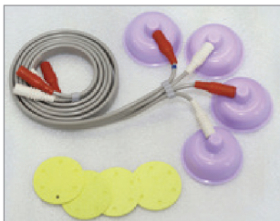
흡인형도자 (Electrode Suction Cups with cables)