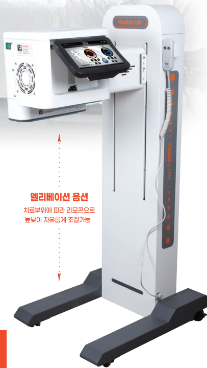
엘리베이션 옵션 치료부위에 따라 리모콘으로 높낮이 자유롭게 조절가능