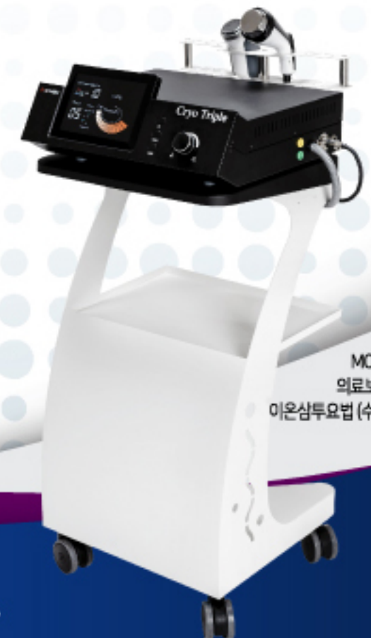
MODEL : CHD-3600 의료보험 수가 적용장비 이온삼투요법 (수거코드 - MX121)