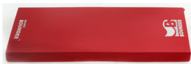
밸런스트랙 매트 50cm×100cm×6cm