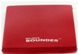
밸런스트랙 트레이너 50cm×50cm×6cm