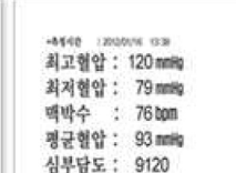
5회 측정 누적 결과지