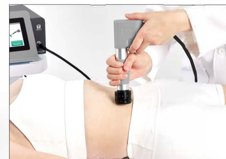
Abdomen : Supine posture / 5-8Hz / 800-1200 shots / 35mm