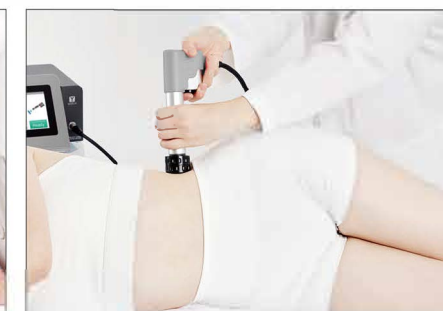
Side roll : lying position, prone position / 5-8 Hz / 800-1200 shots / 35 mm