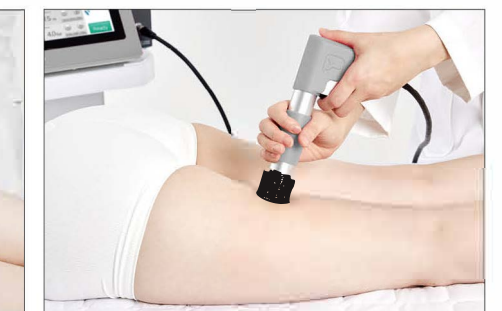
Thighs : lying position, prone position / 8-10 Hz / 800-1200 shots / 35 mm