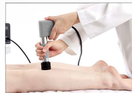
Calf : Prone Posture / 8-10Hz / 800-1200shots / 20,35mm